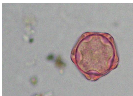
Pylové zrno olše