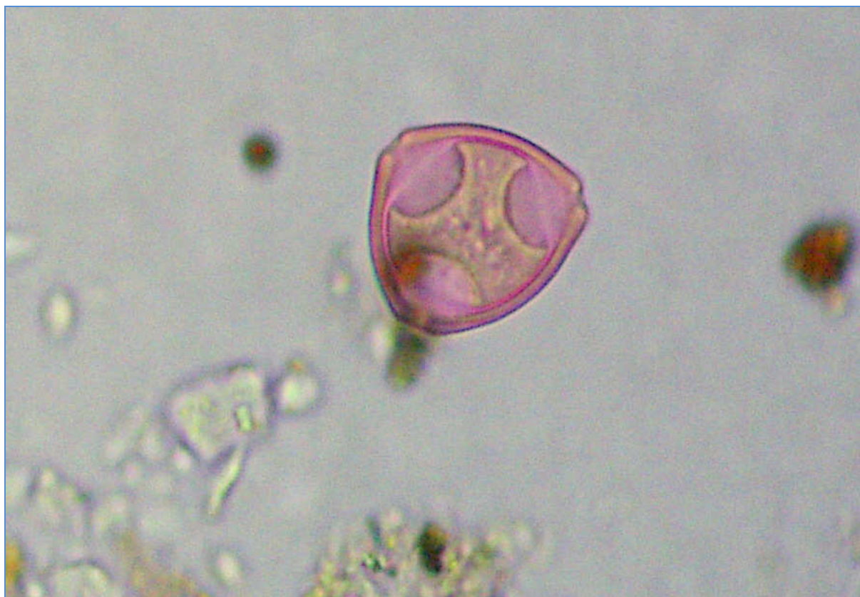
Pylové zrno lísky