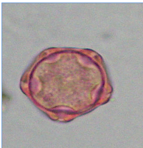
Pylové zrno olše